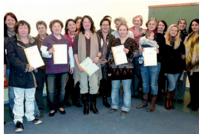
Erfolgreiche Teilnehmerinnen des Aufbaukurses bei der Zertifikatsverleihung

Im Rahmen des „Aktionsprogramms Kindertagespflege“ des BMFSFJ haben die beiden staatlich anerkannten Qualifizierungsträger des Netzwerks (die Familienbildungsstätte Werkstatt Friedenserziehung und das Kath. Bildungswerk Bonn) das Gütesiegel zur Qualifizierung von Tagespflegepersonen durch das Landesjugendamt Rheinland erhalten. Die Eignungsprüfung aller InteressentInnen vor Beginn eines Grundqualifizierungskurses erfolgt durch die Netzwerk Fachberaterinnen. Nach der verpflichtenden Teilnahme an einem Informationsabend zur Qualifizierung erfolgt ein Hausbesuch durch eine Fachberaterin. Sie klärt die persönliche Eignung, die familiäre Situation und die räumlichen Voraussetzungen. Bei InteressentInnen mit Migrationshintergrund wird darüber hinaus auf die sprachlichen Kompetenzen besonders geachtet.