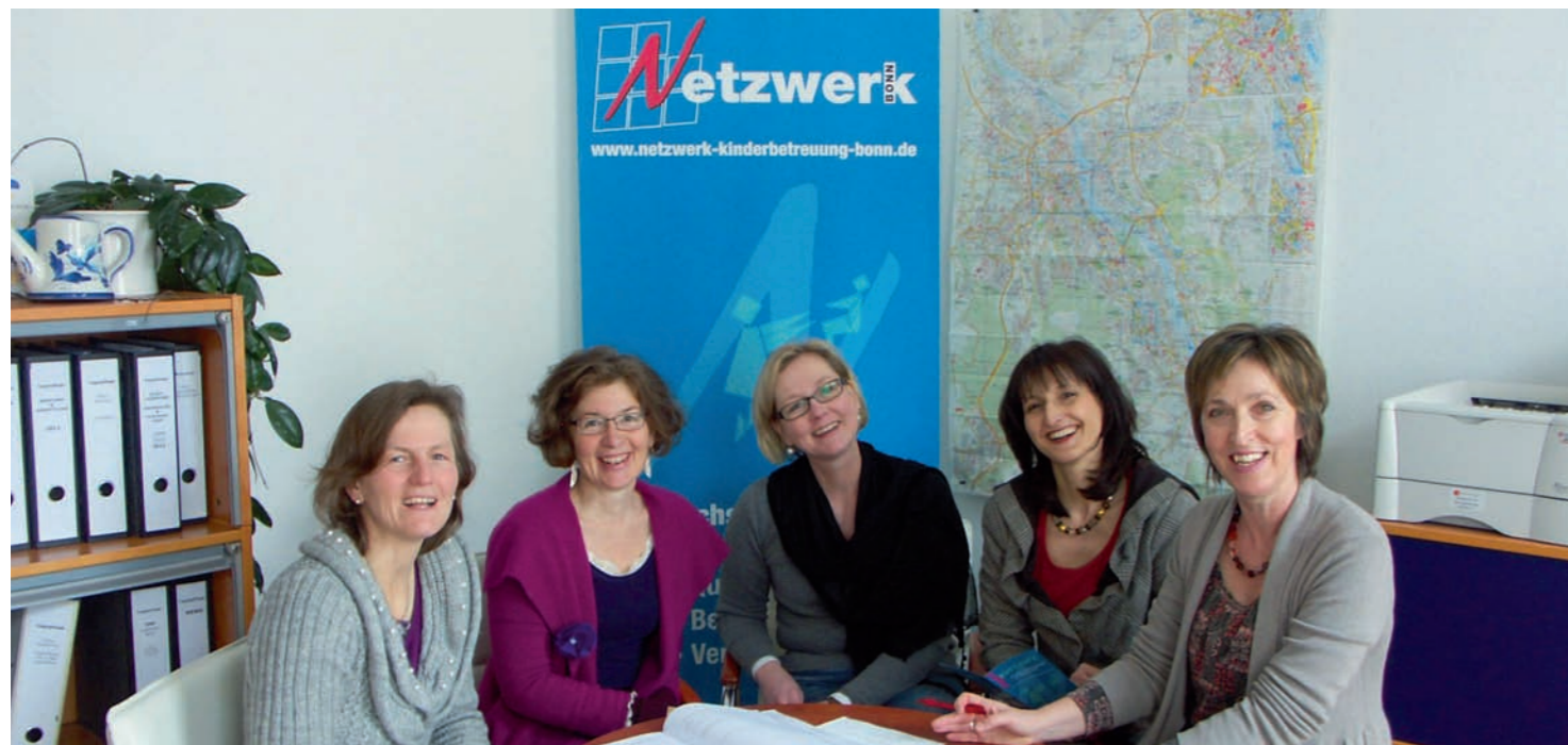
Mitarbeiterinnen des Netzwerk-Arbeitskreises

das Netzwerk unmittelbar über politische Entwicklungen und Veränderungen informiert. Auch über die Stadtgrenzen hinaus leistet das Netzwerk einen kompetenten Beitrag zur Lobbyarbeit für die Kindertagespflege. Der Bundesverband fragte im Rahmen seines Fortbildungsprogramms im Juni 2010 zwei Mitarbeiterinnen des Netzwerks als Referentinnen an. Sie führten ein Seminar zum Thema „Aufbau kommunaler Vernetzungsstrukturen in der Kindertagespflege – aus der Praxis für die Praxis“ in Hannover durch.